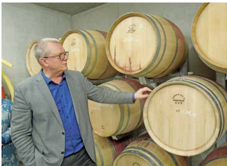
Speciální uložení barikových sudů ve Vinařství Rochůz