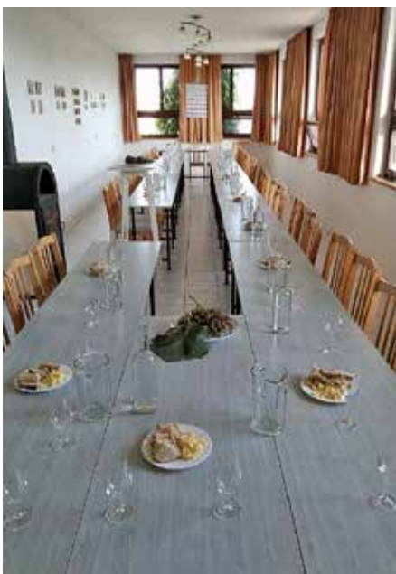
Degustační místnost Golanské výšiny na ŠSV Polešovice