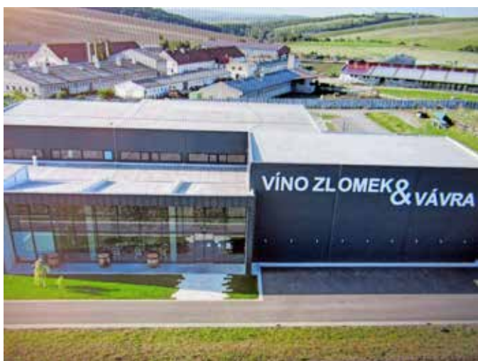
Nové Vinařství Zlomek a Vávra v Boršicích u Blatnice