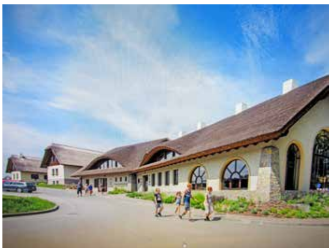
Centrum Slovákých tradic a hotel Skanzen na Modré