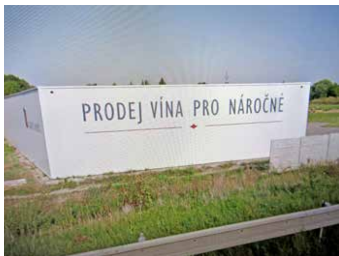
Označení Vinařství Jakubík ve Zlechově